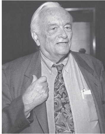
Figura P. 1. William S. Vickrey (1914-96), prêmio Nobel de economia, pai do desenho de mecanismos e o protagonista silencioso deste livro.

leilão de Vickrey para alocar o espaço publicitário em suas páginas na rede. As intuições de Vickrey em relação a planejamento urbano e pedágio urbano estão mudando aos poucos a fisionomia das cidades, e têm um papel importante nas estratégias de precificação em aplicativos como o Uber e o Lyft. 2