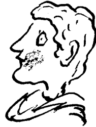
Horácio Amigo de Hamlet