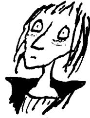
Hamlet Filho do antigo rei Sobrinho de Cláudio