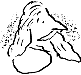
① fantasma do pai de Hamlet