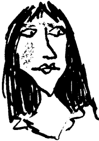
Gertrudes Rainha da Dinamarca Mãe de Hamlet