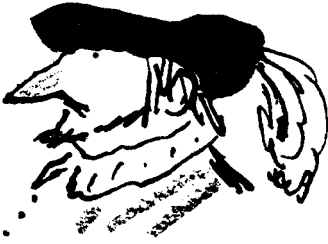
Dom Pedro Príncipe de Aragão