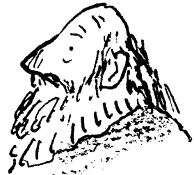
Leonato Governador de Messina