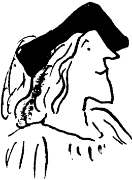
Benedito Companheiro de dom Pedro