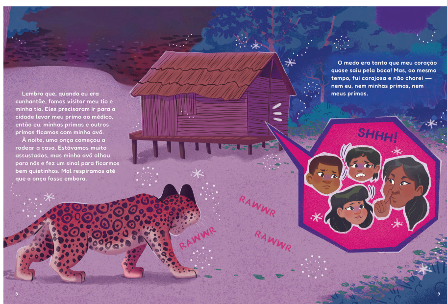
Palafitas, moradias típicas da região.

As ilustrações de Raquel Teixeira aprofundam o olhar do leitor sobre o território amazônico e a vida ribeirinha, revelando, em imagens ricas e detalhadas, aspectos da arquitetura, alimentação, transporte, fauna, flora e espiritualidade do povo Mura.