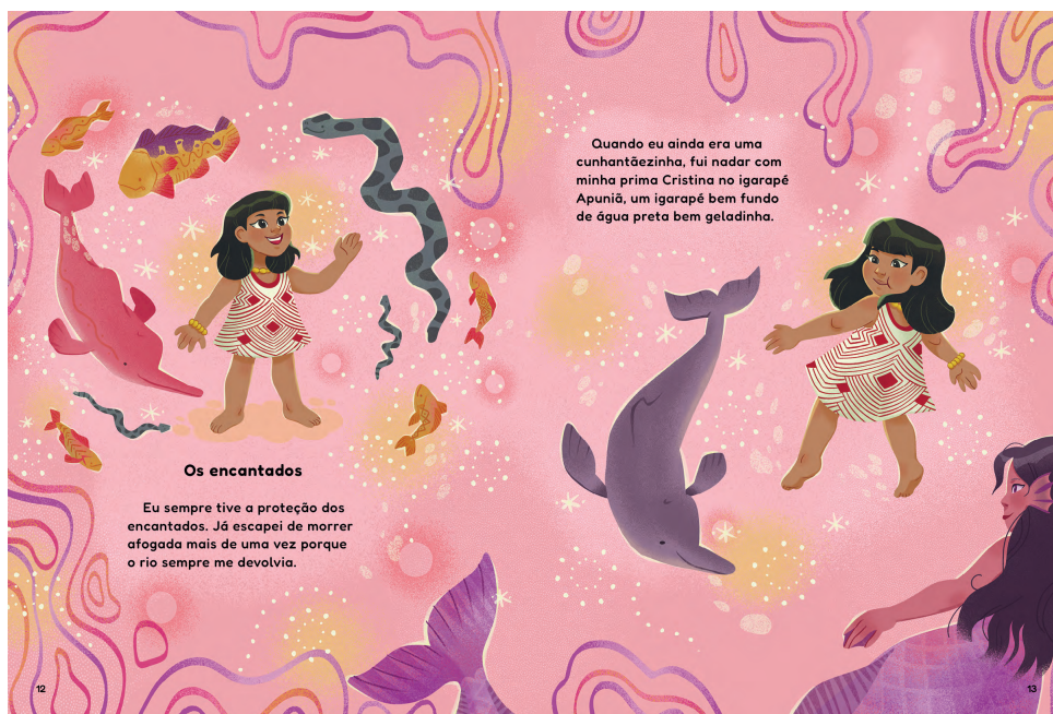
Encantados das águas: cobra-grande (sucuri), boto-vermelho (ou rosa), boto-tucuxi (boto-cinza) e lara.

Cosmogonia: narrativas, princípios e mitos de um povo acerca da criação da Terra, do Universo e dos próprios seres humanos, envolvendo também questões e crenças espirituais.