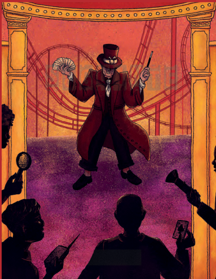
Imagem de A mágica mortal , ilustrado por Jonnifferr.